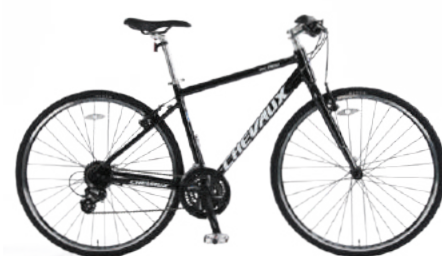
● Màu đen