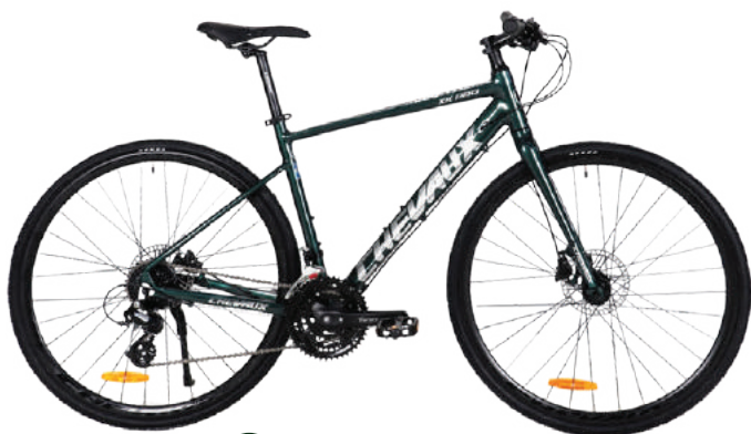
● Màu xanh rêu