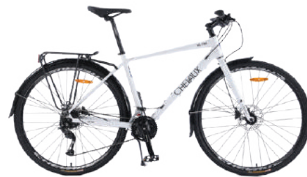
○ Màu trắng