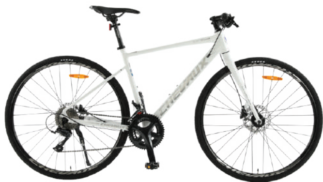
○ Màu trắng