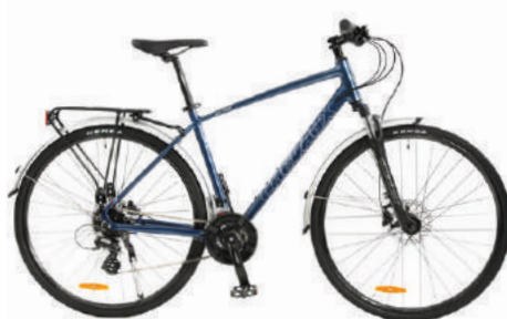
● Màu xanh