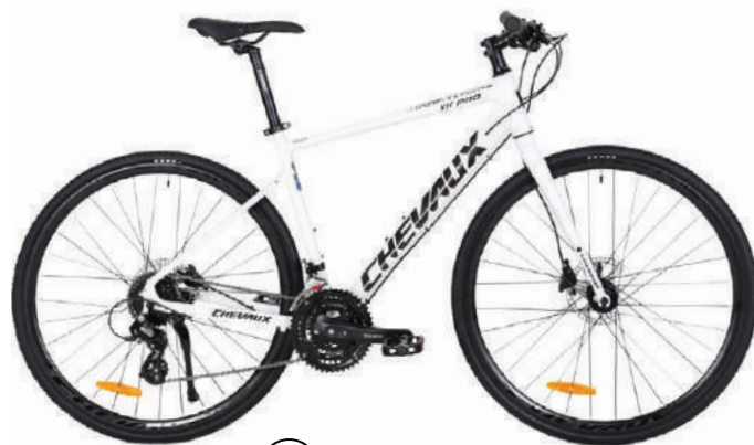
○ Màu trắng