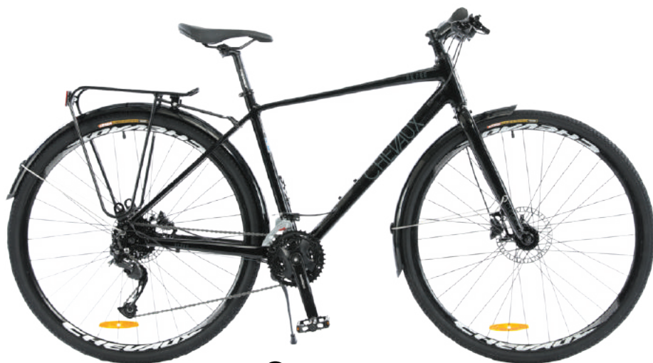
● Màu đen