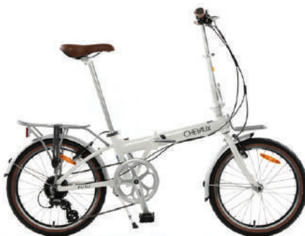
○ Màu trắng