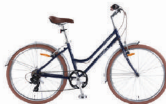
● Màu xanh thẫm