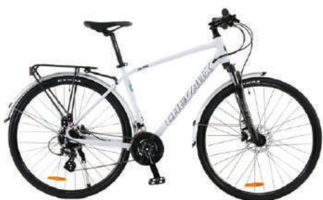
○ Màu trắng