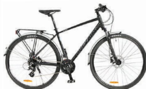
● Màu đen