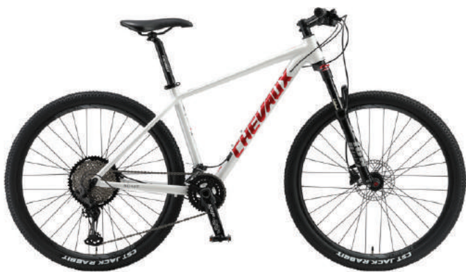
○ Màu trắng