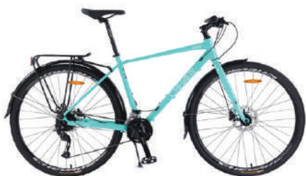
● Màu xanh nhạt