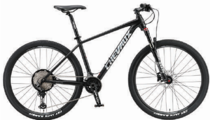
● Màu đen