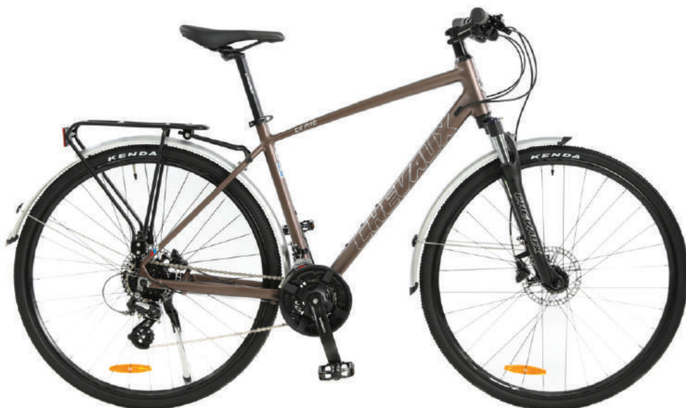
● Màu nâu