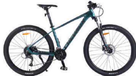
● Màu xanh