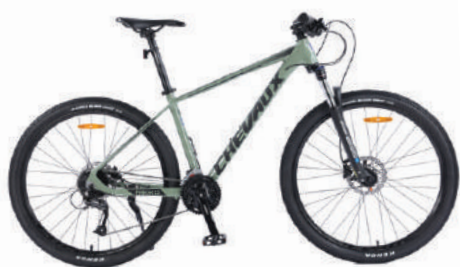
● Màu cỏm