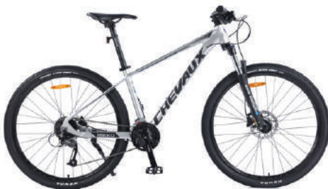
○ Màu trắng