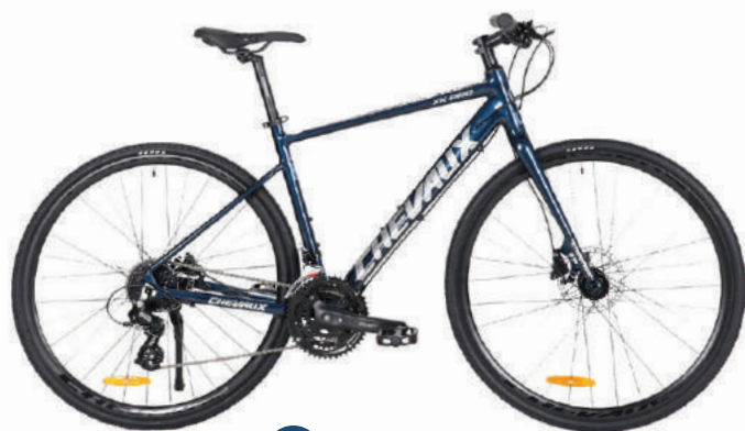
● Màu xanh