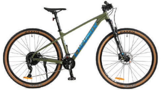
● Màu cốm