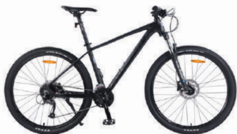
● Màu đen