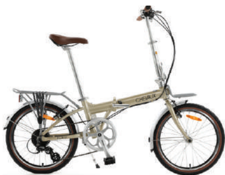
● Màu nâu