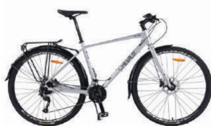
● Màu bạc