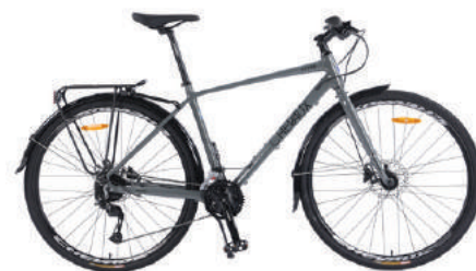
● Màu xám