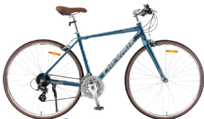
Màu xanh trắng