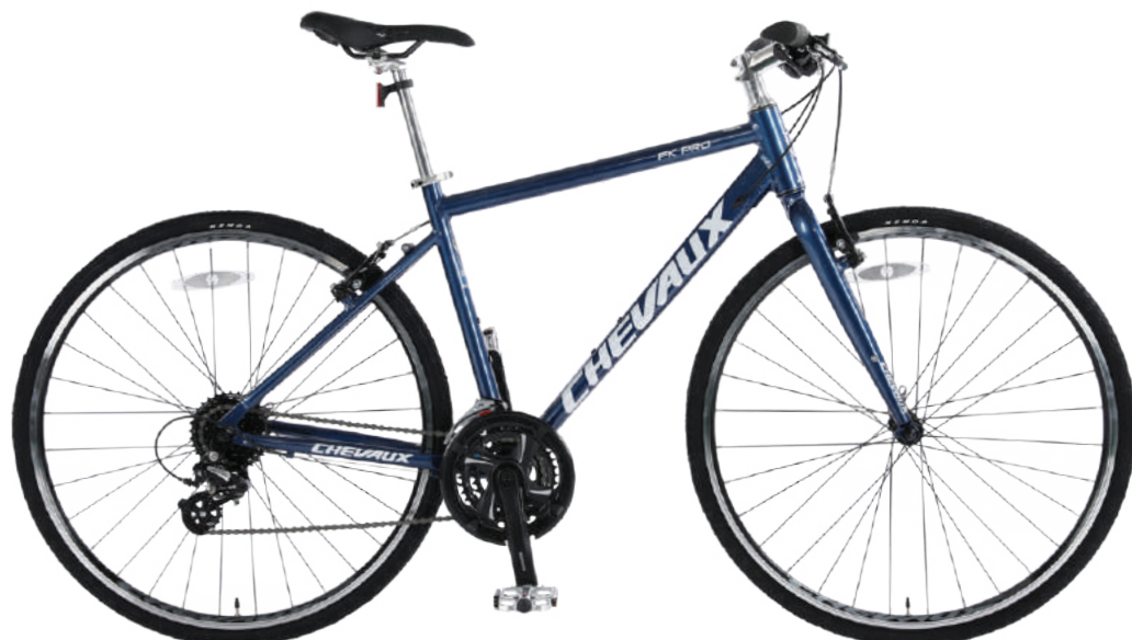
● Màu xanh đậm