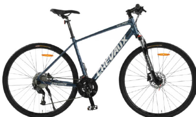
● Xanh đen