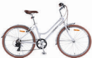
○ Màu trắng