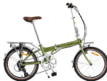
● Màu cỏm