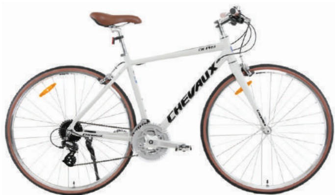
Màu trắng đen