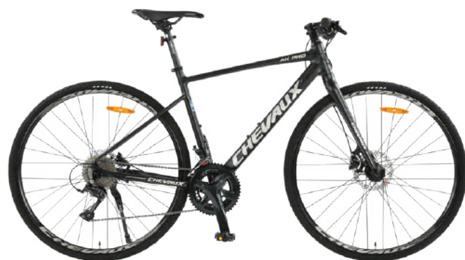
● Màu đen