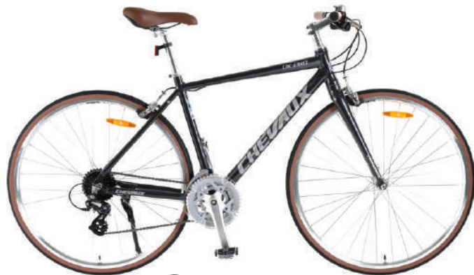
Màu đen xám