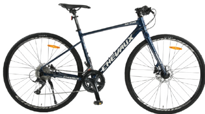
● Màu xanh