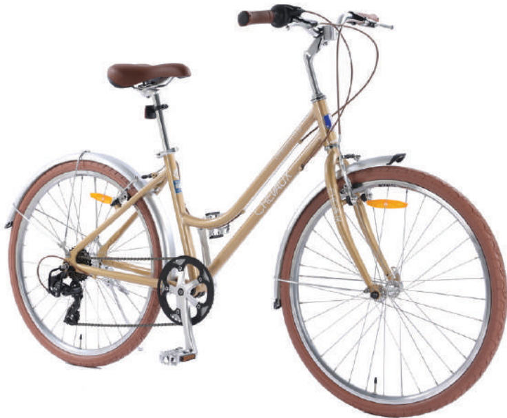
● Màu vàng