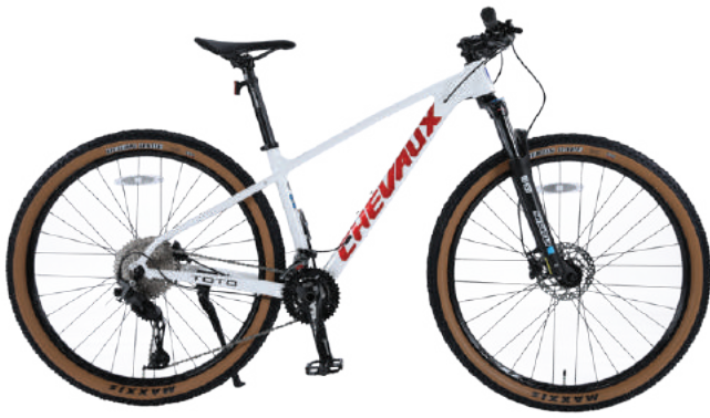
○ Màu trắng