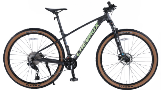
● Màu xám