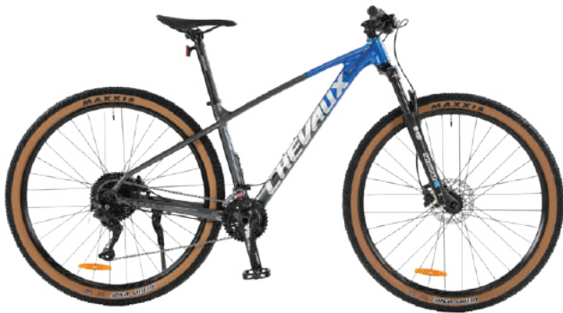
● Màu xanh xám