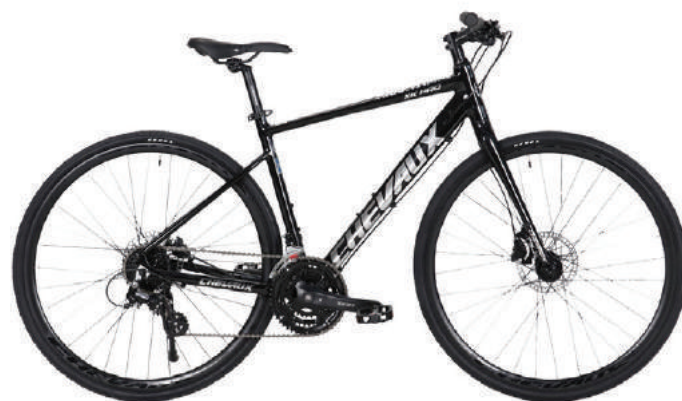
● Màu đen