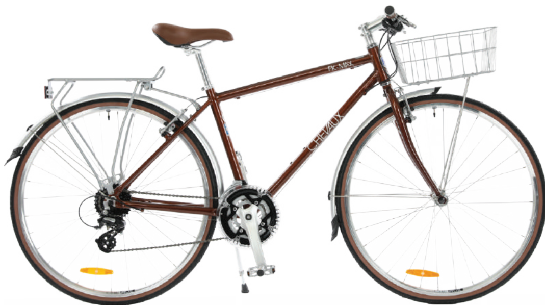
Màu đỏ đô