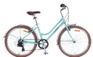
● Màu xanh ngọc