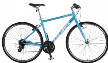
● Màu xanh nhạt