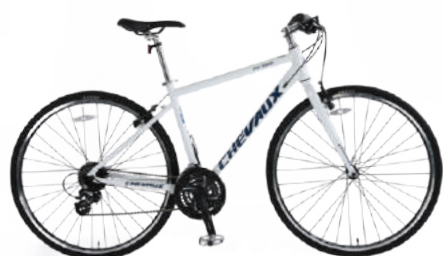
○ Màu trắng