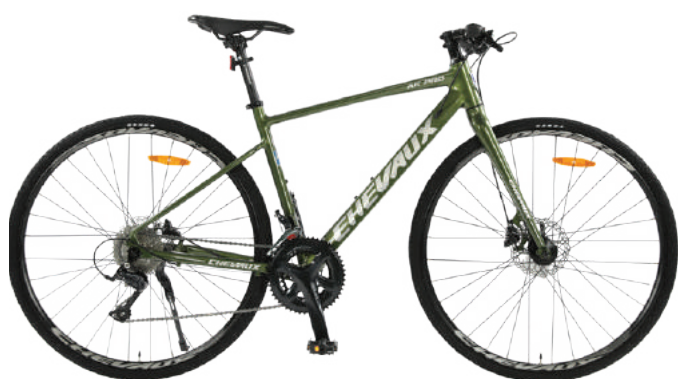
● Màu cỏm